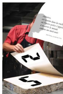
Avec nos vœux les plus chaleureux